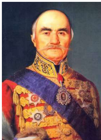
Милош Обреновић Књаз Српски