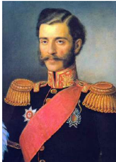
Михајло III Обреновић Књаз Српски