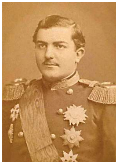
Милан IV Обреновић Књаз Српски