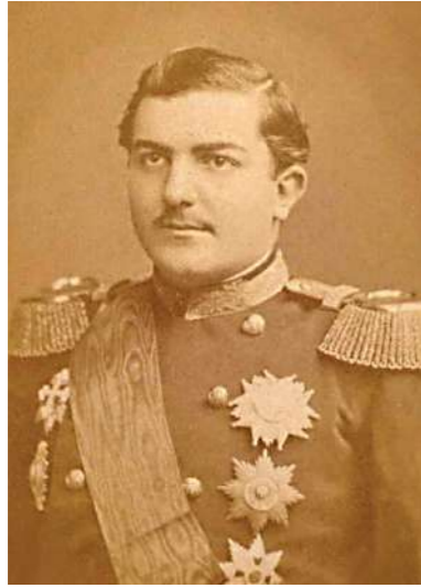
Милан IV Обреновић Књаз Српски