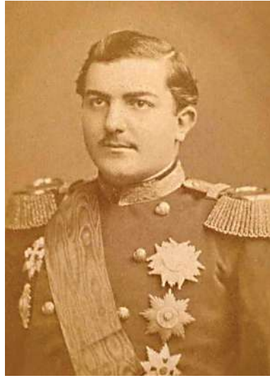
Милан IV Обреновић Књаз Српски